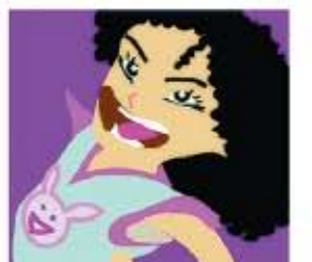
איור: אמיתי סנדי